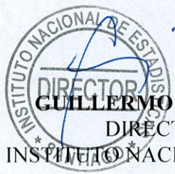
GUILLERMO PATTILLO ÁLVAREZ DIRECTOR NACIONAL INSTITUTO NACIONAL DE ESTADÍSTICAS